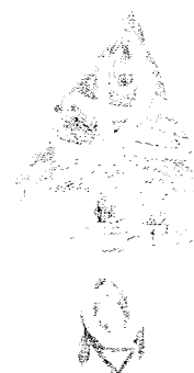
Disegno di Gabriele Sabatino

Vi sarete certamente accorti che durante ogni domenica dell'Avvento è stato acceso un Cero...Tutti e quattro, formano insieme la CORONA D'AVVENTO, una antica consuetudine soprattutto nei paesi germanici che, sin dal XVI secolo nelle case dei cristiani è diventata simbolo dell'Avvento. La corona, con il progressivo accendersi delle sue quattro luci, domenica dopo domenica, fino alla solennità del Natale, è memoria delle varie tappe della storia della salvezza prima di Cristo e simbolo della luce profetica che via via illuminava la notte dell'attesa fino al sorgere del Sole di giustizia. La Corona di solito si prepara realizzando un cerchio con foglie di alloro o rametti di abete (il loro colore verde simboleggia la speranza, la vita), con quattro ceri e può essere appoggiata su un ripiano o venire appesa al lampadario. L'accensione di ogni cero può essere accompagnata da un momento di preghiera e da un canto alla Madre di Gesù.