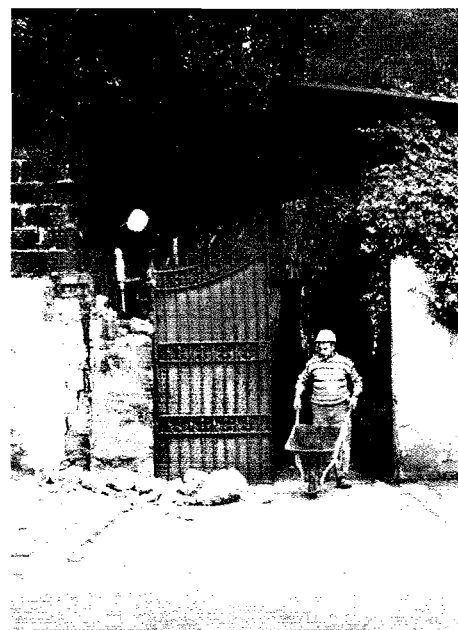
L'inizio dei lavori (15.12.05)

I contributi potranno essere consegnati direttamente al parroco o tramite c/c.p 36809804 intestato a Parrocchia di S. Maria delle Grazie a Capodimonte – Causale: Pro Oratorio.